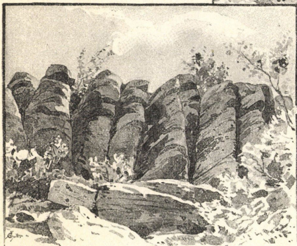
A Pogányvár. (Dr. Pápai Károly felvétele után rajzolta Dörre Tivadár.)

lyek azonban ma már felismerhetlenek. E helyről a következőt regélik: Egy kondás járt itt az Alföldről makkolni. Egy este egy kis asszonyforma ment hozzája, leült melléje, de nem szólt semmit. A kondás, a kiszalonnát csepegtetett, „pirítót“ adott az asszonyformának. Ez erre azt